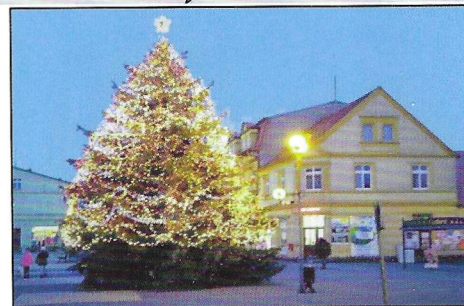
Weihnachten am Krautmarkt Flatow